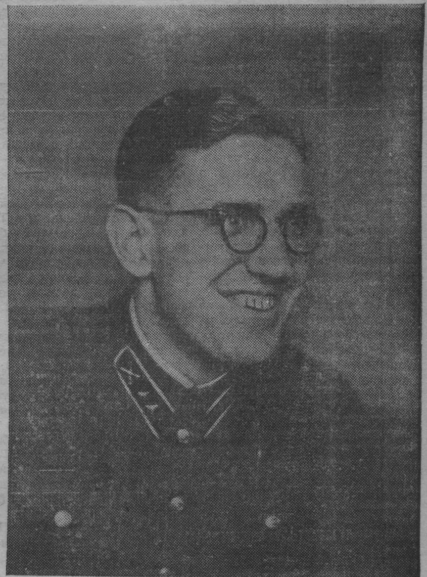
На снимке: чемпион Европы по конькам Альфонс Берниш (Латвия). А. Берниш находится сейчас в рядах РККА.