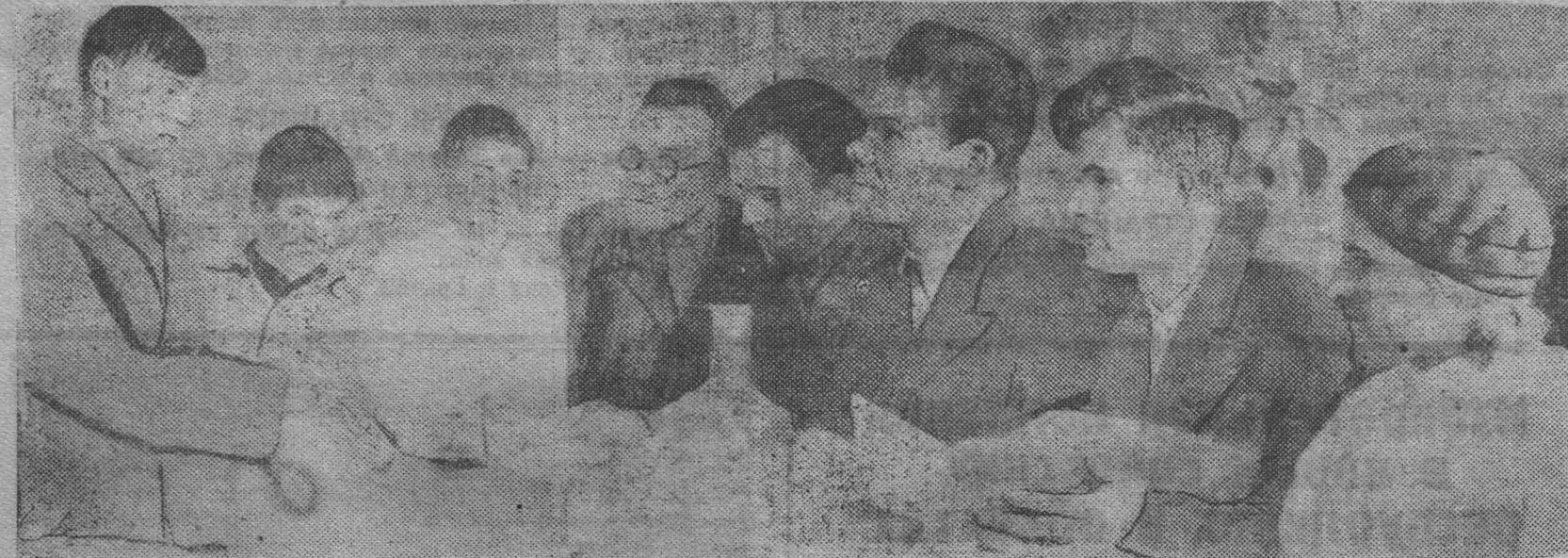
На снимке: городская комиссия по призыву молодежи в ремесленные, железнодорожные училища и школы фабрично-заводского обучения за работой.