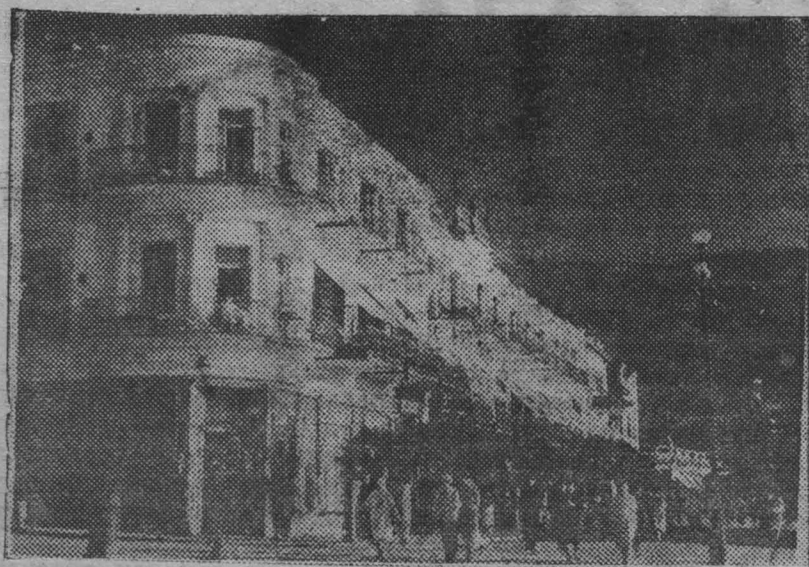
На снимке: санаторий им. 17 партс'езда в Янте.