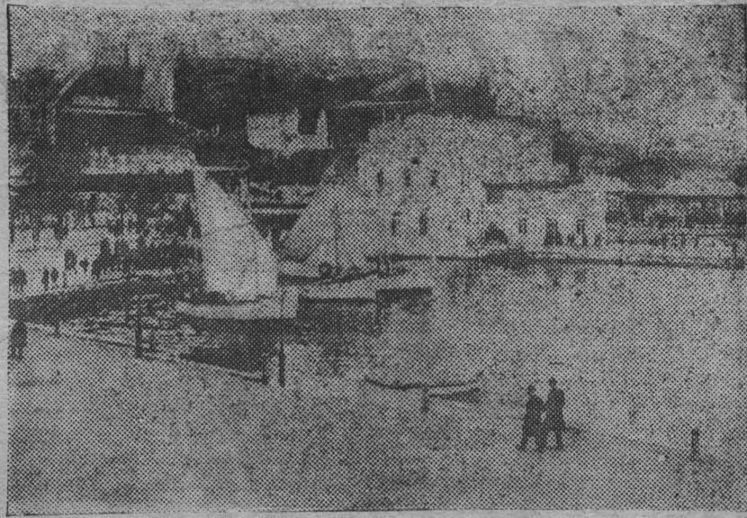
Война между Италией и Грецией. На снимке: Греческий остров Корфу.