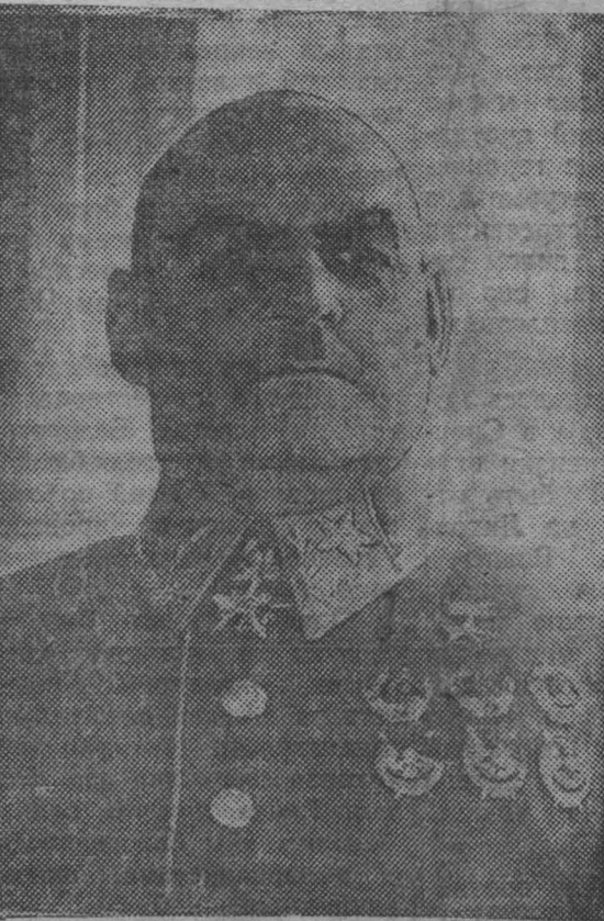
Маршал Советского Союза Г. И. КУЛИК.