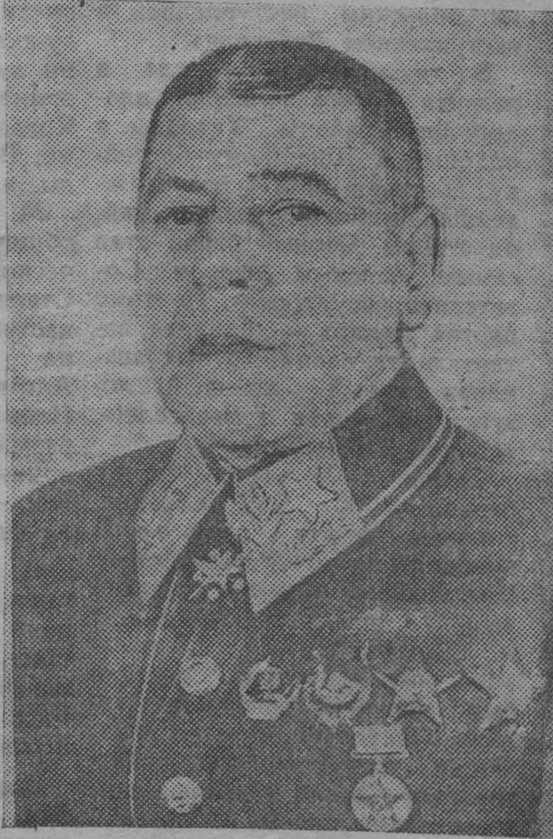
Маршал Советского Союза Б. М. ШАПОШНИКОВ.

14 ноября утром Председатель Совета Народных Комиссаров СССР и Народный Комиссар Иностранных Дел тов. В. М. Молотов выехал в Москву.