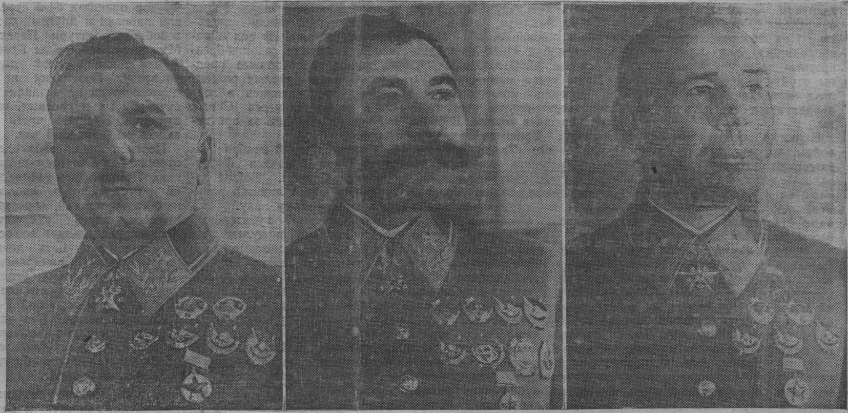
Маршал Советского Союза К. Е. ВОРОШИЛОВ. Маршал Советского Союза С. М. БУДЕННЫЙ. Маршал Советского Союза С. К. ТИМОШЕНКО

Одновременно Маршалам Советского Союза были вручены Грамоты Президиума Верховного Совета СССР. (ТАСС.)