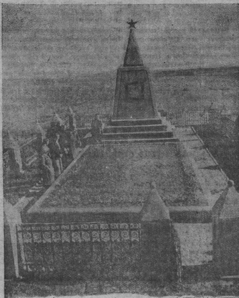
16 ноября 20-летие освобождения Крыма от Врангеля. На снимке: памятник погибшим в бою при взятии Перекопа (Красноперекопский район, Крымская АССР).

Майор-оленоводец Г. ТОЛОКОЛЬНИКОВ, участник перекопских боев.