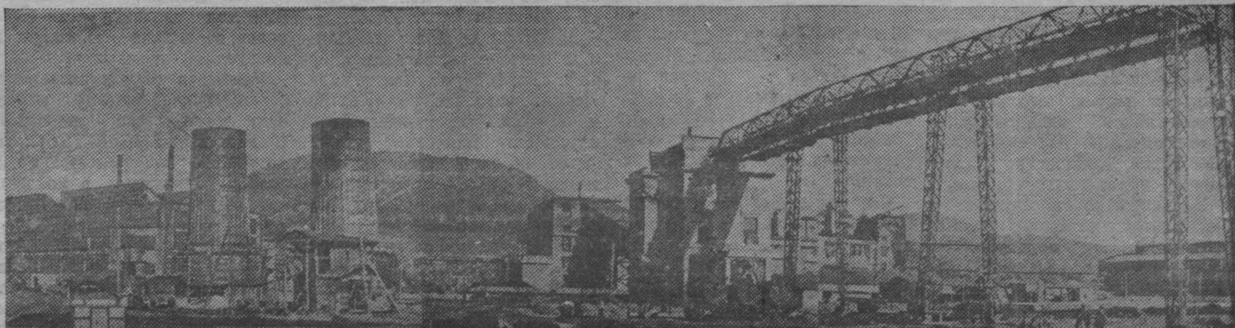
На новостройках третьей сталинской пятилетки. На территории основанного свыше 150 лет тому назад Петровско-Забайкальского завода (Читанская область), ныне строится крупнейший металлургический завод Забайкалья. Уже пущены две мартеновские печи, газогенераторная станция, получена первая забайкальская сталь. На снимке: общий вид Петровско-Забайкальского металлургического завода.