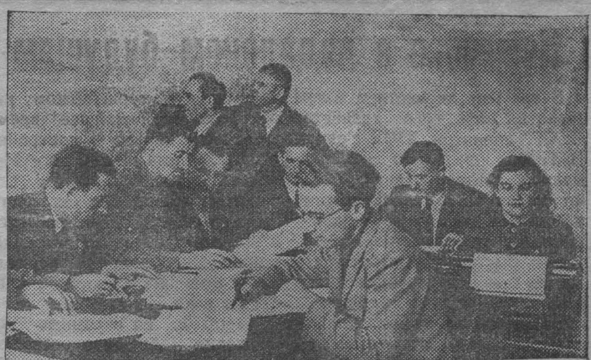
Избирательная кампания в западных областях Украины. На снимке: работники Шевченковского районного Совета (г. Львов) составляют списки избирательных округов.