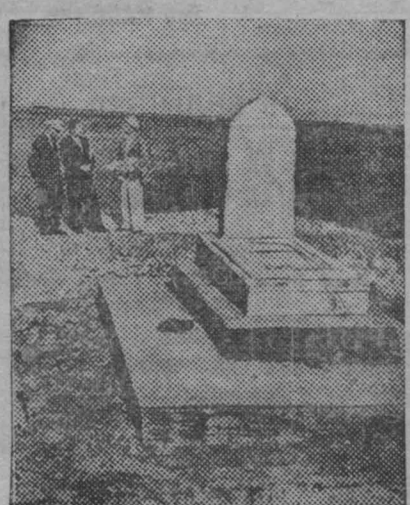
В мае 1941 года исполняется 80 лет со дня рождения великого азербайджанского классика литературы Низами. В 7 километрах от города Кировобад в Шихим Дьюз (Азербайджанская ССР) находится могила великого азербайджанского классика литературы Низами. Сейчас могила реставрируется. На ней будет установлен мавзолей. На снимке: могила Низами.