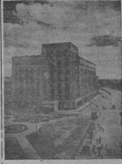
На снимке: Покровские ворота (Москва). Жилой дом, построенный по проекту архитектора Череповец.

Работы академика Лысенко в течение двух лет широко демонстрируются в завальбоне «Зерно» и экспонатных участках выставки. (ТАСС).