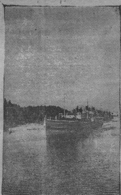
Первый рейс Ленинград—Сортавала. Началось грузопассажирское сообщение по линии Ленинград—Балаам—Сортавала. Линию обслуживает пароход «Володарский».

На снимке: пароход «Володарский» проходит шхеры у острова Балаам.