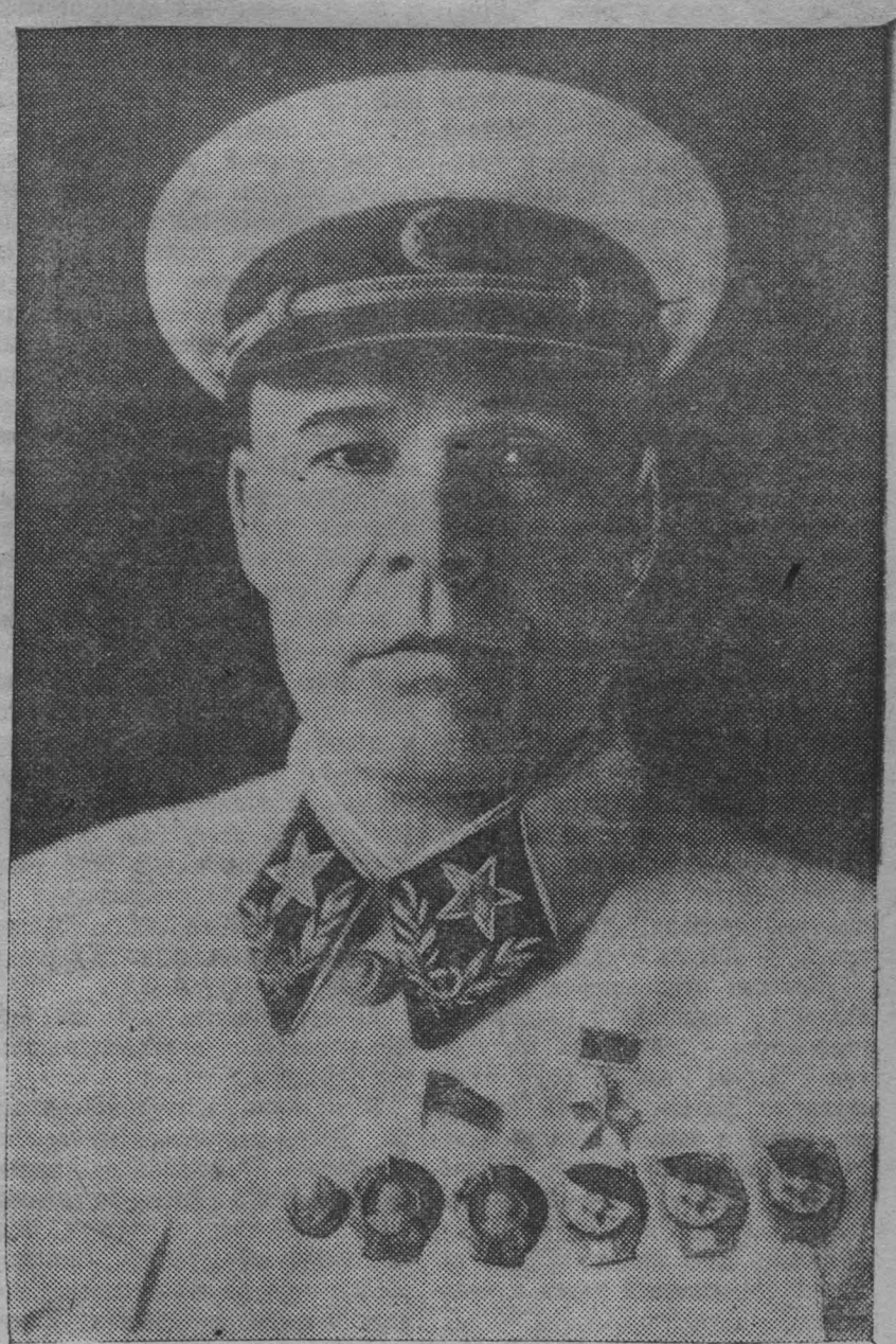
На снимке: Народный Комиссар Обороны СССР Маршал Советского Союза С. К. Тимошенко.