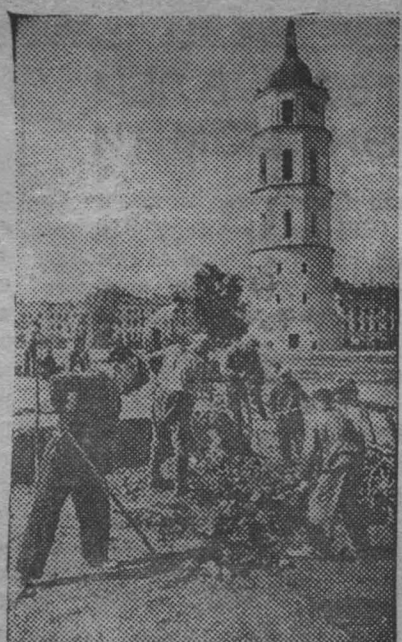
Город Вильно активно готовится к предстоящему переизданию правительства Литовской ССР в древнюю столицу страны. Идет ремонт дорог, площадей, зданий, разбиваются новые скверы и газоны. На снимке: работа по благоустройству центральной площади города.

Западно-Таймырская экспедиция Главного управления Северного морского пути открыла в устье Енисея и у островов Диксон богатейшие залежи угля. Усть-Енисейская — обнаружила признаки нефти. Нордвикская — разведала в районе бухты Коженикова 14 нефтеносных горизонтов.