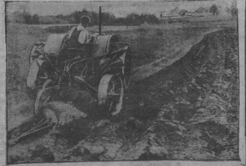
На снимке: вспахивается земля Советской Латвии.