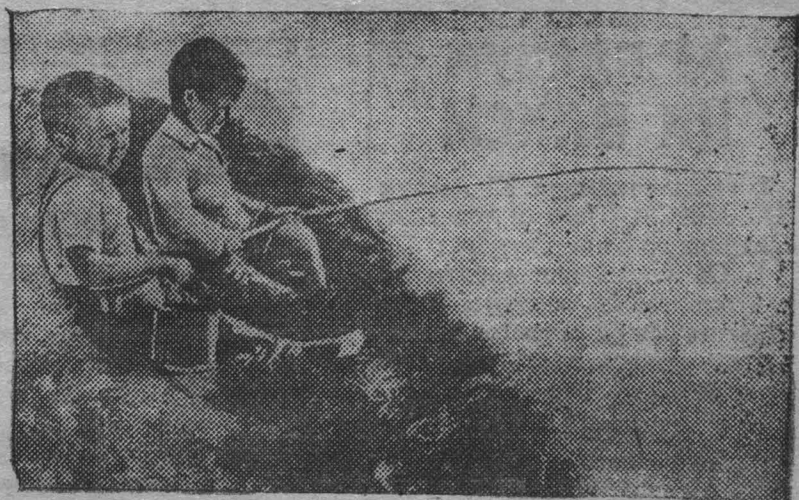
На реке Томи.