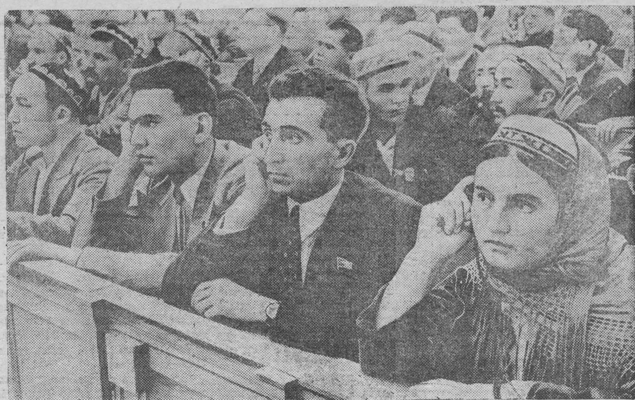
Третья Сессия Верховного Совета Союза ССР. На снимке: В Большом Кремлевском дворце на совместном заседании Совета Союза и Совета Национальностей. (Фотохроника ТАСС).

Среди пахарей регулярно проводится изучение материалов третьей Сессии Верховного Совета СССР. В.