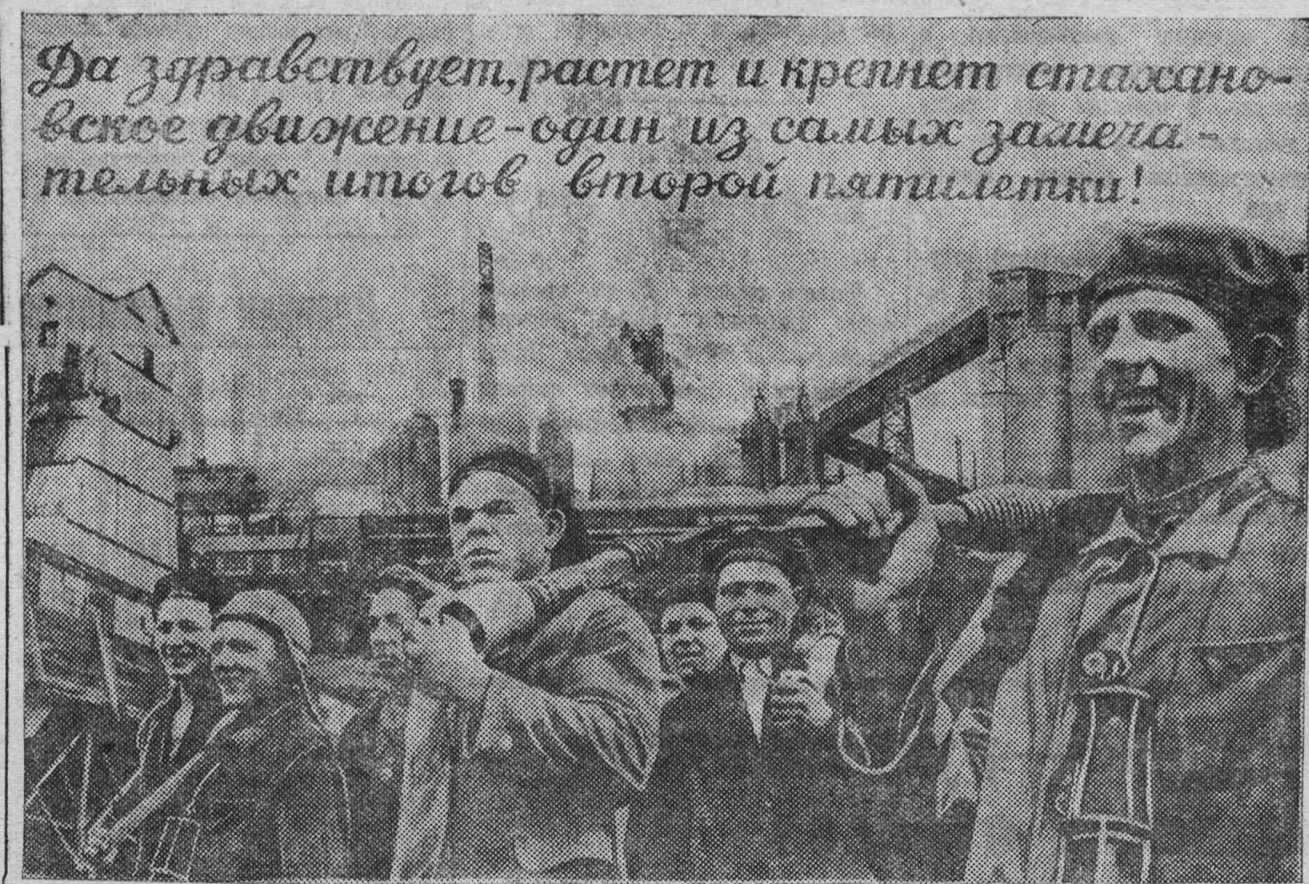
Фото-монтаж художника В. П. Скобликова.

Ростова-на-Дону и от Саратова, к югу от Оренбурга и от Омска, к северу от Томска идут необъятнейшие пространства, на которых уместились бы десятки громадных культурных государств. И на всех этих пространствах парит патриархализм, полудикость и самая настоящая дикость».