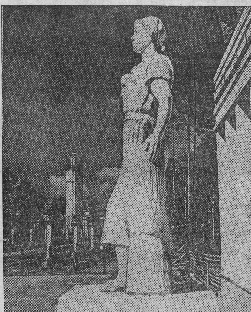
На строительстве Всесоюзной сельскохозяйственной выставки. На снимке: скульптура колхозницы, установленная у здания управления выставки.

По полученным в Париже сведениям, опубликованный на днях германо-итальянский договор о военно-политическом союзе имеет также секретные статьи. Французские газеты указывают, что Италия на основе этих секретных статей обязана поддержать Германию в войне с Польшей, а Германия — Италию.