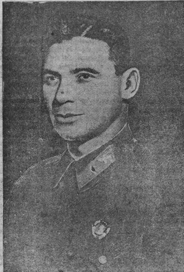
На снимке: Герой Советского Союза комбриг В. К. КОККИНАКИ.