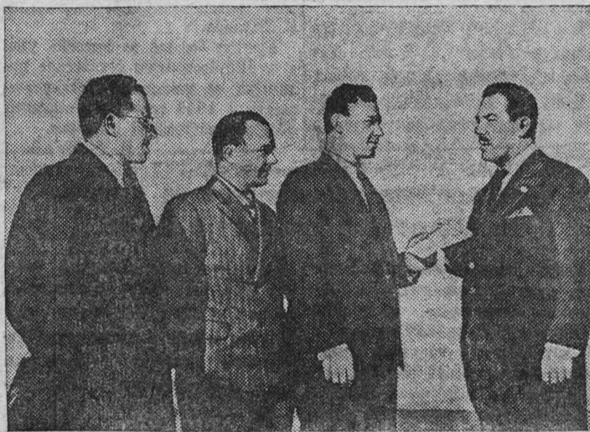
Товарищи Коккинаки и Гордиенко во время пребывания в США посетили Международную выставку в Нью-Йорке. На снимке: тов. Коккинаки передает председателю комитета выставки Уэллену письма из Москвы. Слева направо: полпред СССР в США т. Уманский, тт. Гордиенко и Коккинаки и т-н Уэллен.