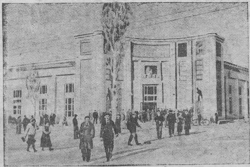
По городам Советского Союза. На снимке: Новое звуковое кино на ул. Дзержинского в городе Фрунзе.