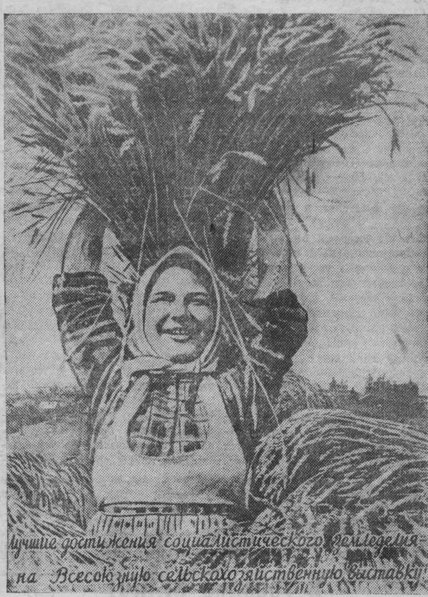
На снимке: плакат работы художника Н. Скурихина, выпущенный издательством «Искусство» к открытию Всесоюзной сельскохозяйственной выставки.

Добровольные оборонные общества обязаны помочь миллионам отважных советских патриотов освоить военное дело так, чтобы они могли с честью выполнить священный долг защиты родины по первому зову правительства, партии, любимого Сталина.