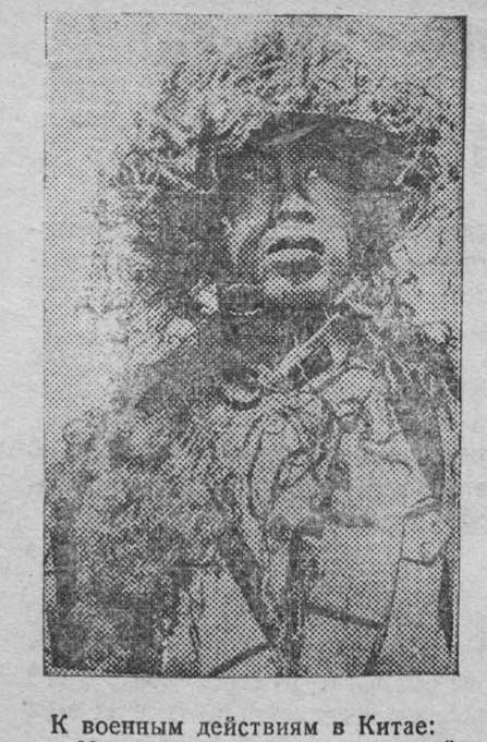
К военным действиям в Китае: На снимке: замаскированный младший командир китайской армии.