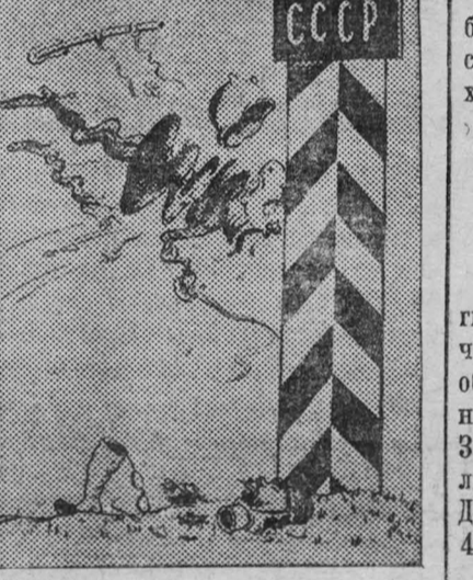
Всесоюзная художественная выставка «Индустрия социализма». На снимке: рисунок художников Кукрыникозы — «Любой агрессор разобьет свой медный лоб о советский пограничный столб» (В. Молотов).

В базовых яслях (Притомский участок) сейчас помещается 97 ребят, тогда как ясли рассчитаны на 88 человек. Кроме того, на очереди здесь записано еще 33 ребенка. А вот ясли № 6, в районе швейцарки, систематически не выполняют плана по обслуживанию детей. Некоторые ясли не выполняют своих планов еще и потому, что они оборудованы уж очень скудно. Между тем, каждая мать стремится определить ребенка в такие ясли, которые помещены в благоустроенном здании, где имеется хорошая мебель, игрушки, где для отдыха детей созданы все условия.