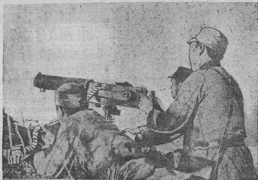
К военным действиям в Китае. На снимке: Пулеметчики китайской армии в горах северной Хунани.