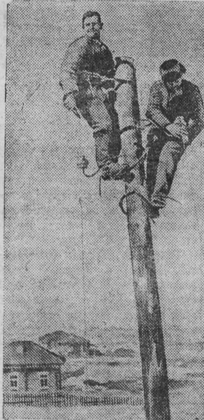
Электрификация с. Березово. На снимке: Монтеры за подвеской проводов.

В этом году проводится полная реконструкция городской высоковольтной сети. Электропровода с сечением в 58 квадратных миллиметров, заменяются электропроводами в 120 кв. миллиметров. Это даст возможность пропускать ток большого напряжения с наименьшими потерями. Подготавливается к пуску городская электростанция, от которой будет питаться электроэнергией тяговая подстанция трамвая.