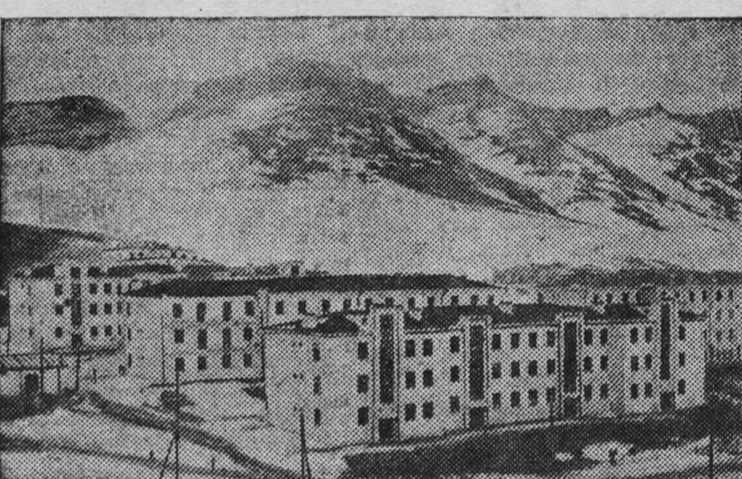
На свинцовом руднике Ачсай — базе крупнейшего в СССР Чимкентского свинцового завода (Южно-Казахстанская область), построенного во второй пятилетке. На снимке: общий вид домов рудничного поселка.

создает простой железнодорожных вагонов. За простои вагонов шахтоуправление ежемесячно выплачивает по 18—25 тысяч рублей, а ведь есть возможности устранить неполадки на погрузке угля, добиться полной ликвидации простоев вагонов. Беза в том, что наши руководители не хотят заняться погрузкой. Руководители шахты обязаны немедленно устранить все эти неполадки на погрузке угля. ЗЫРЯНОВ, КОЗЛОВ.