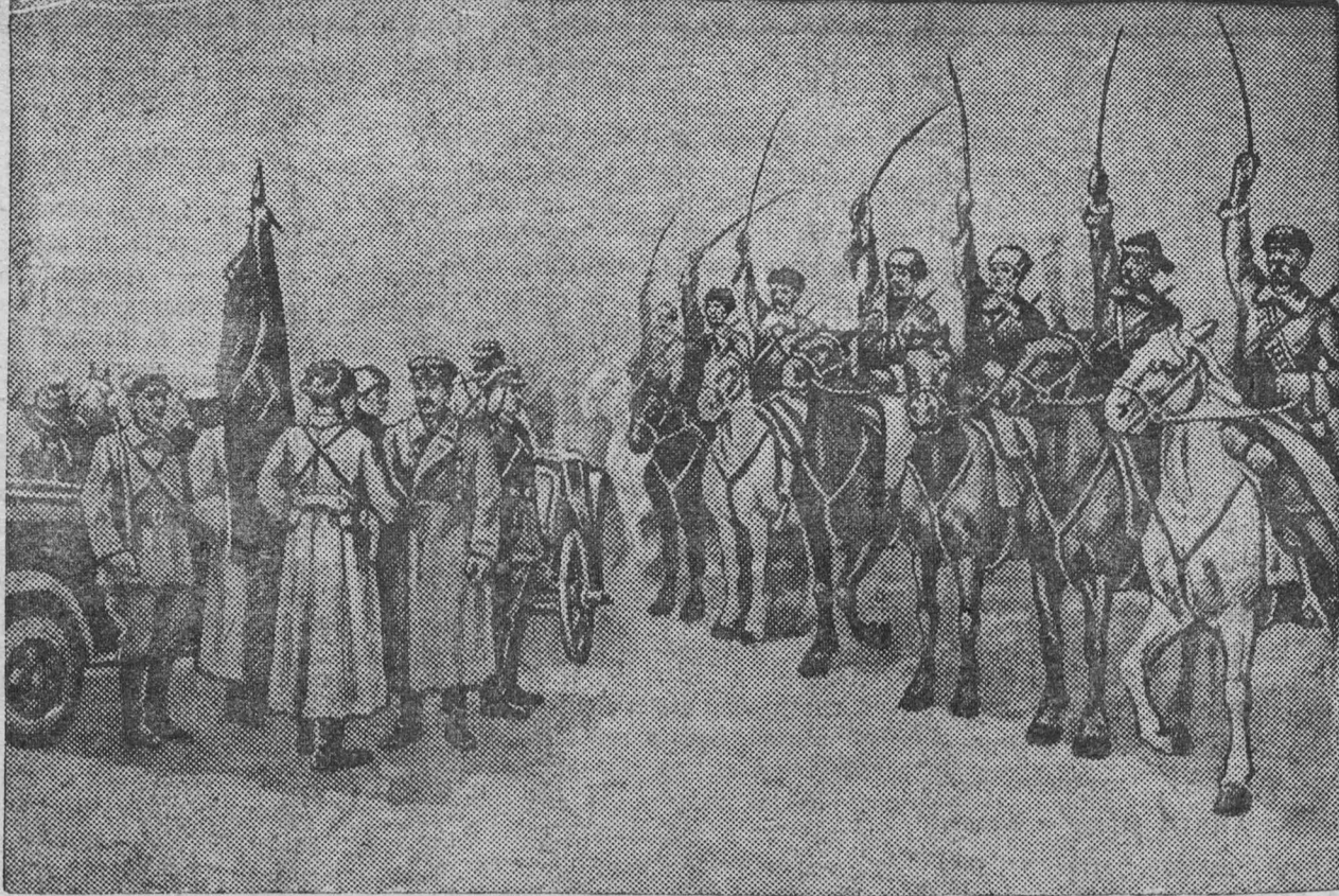
Выставка «Ленин и Сталин в народном изобразительном искусстве». И. В. Сталин вручает красные знамя Луганскому полку.