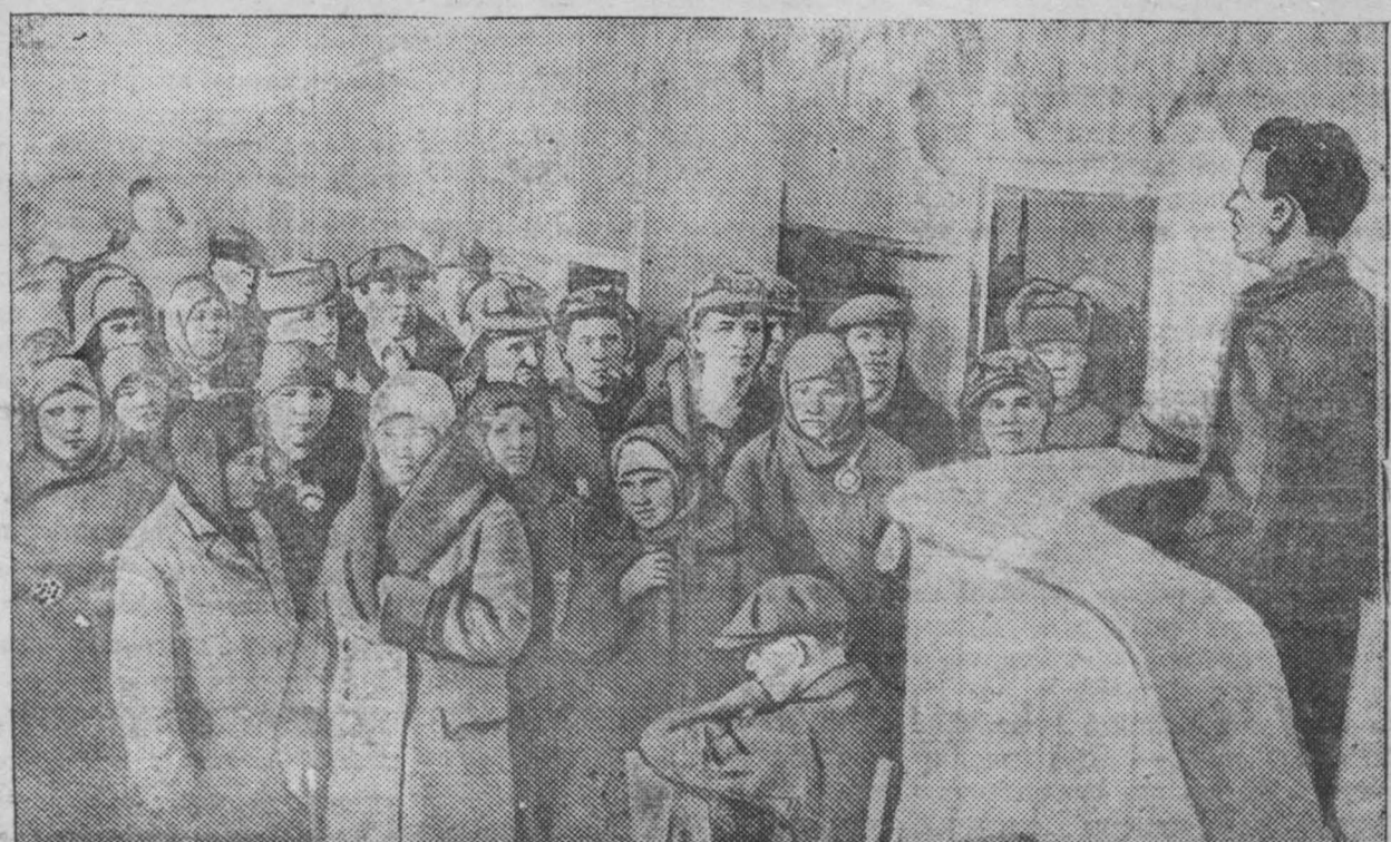
По всем шахтам треста «Кемеровоуголь» десятого марта проходили многолюдные митинги, посвященные открытию XVIII съезда ВКП(б). На снимке: Митинг горняков шахты «Центральная», на котором присутствовало свыше четырехсот человек.

Да здравствует партия большевиков и великий вождь трудящихся всего мира, любимый Иосиф Виссарионович Сталин!