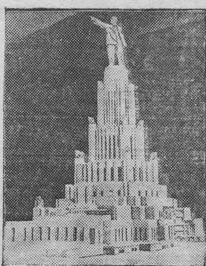
В мастерских экспериментальной базы Дворца Советов закончено сооружение большой модели Дворца Советов, имеющей несколько метров высоты. Модель выполнена из 117,5 тысяч кварцевых камней, газганского мрамора и других материалов. На снимке: Модель Дворца Советов.

ников республиканской Испании. Консервативный член парламента Эверард заявил, что он требует от министра иностранных дел, чтобы ни один руководитель испанских антифашистов не был допущен на английскую территорию. Положение защитников Испанской республики становится все более тяжелым. Генерал Франко объявил блокаду побережья республиканской Испании. Командирам фашистских подводных лодок приказано топить любой пароход, который здесь появится. Французский пароход, направляющийся в Валенсию с продовольствием, захвачен мятежниками. В Мадриде продолжается жестокий террор против верных республике лиц. Иностранная печать сообщает, что героический боец за республиканскую Испанию коммунист Галан — расстрелян. Большое количество республиканских руководителей арестовано и им грозит военно-полевой суд. Нет никаких сведений о ряде выдающихся полководцев республиканской армии. (ТАСС).