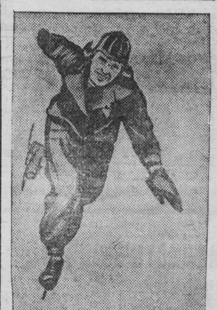
НА КАТКЕ (Из снимков, присланных на конкурс).

Товарищи займодержатели, спешите обменять свои облигации. Обменные облигации на заем 1938 года будут участвовать в дальнейших тиражах, которые состоятся 10 апреля, 10 июня, 10 августа, 10 октября, 10 декабря 1939 года.