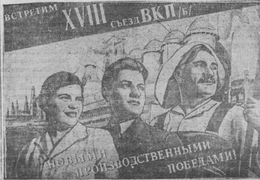
На снимке: Плакат работы художника В. Коренного, подготовляемый к печати издательством «Искусство»