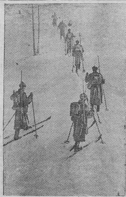
К XXI годовщине Красной Армии и Военно-Морского флота. На снимке: бойцы Н-ской части Московского военного округа идут на лыжах на стрелковые занятия.