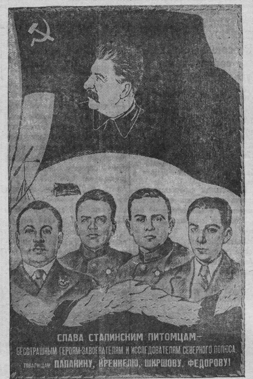
СЛАВА СТАЛИНСКИМ ПИТОМЦАМ — БЕССТРАШНЫМ ГЕРОИМ-ЗАВОЕВАТЕЛИМ И ИССЛЕДОВАТЕЛЯМ СЕВЕРНОГО ПОЛЮСА

рища Сталина. В тот же день самолеты воздушной экспедиции покинули лагерь. 7 июня ознаменовалось первым крупным научным открытием папанинцев: глубина океана на Северном полюсе оказалась равной 4.290 метрам.