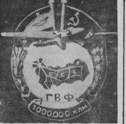
На снимке: Новый нагрудный серебряный знак, которым будет награждаться летно-подъемный состав гражданского воздушного флота за 1 миллион километров, пройденных без аварий с начала работы. Фотохроника ТАСС.

стильной промышленности. Придильные фабрики используются в настоящее время всего на 53 проц. своей производственной мощности. Жесточкий кризис переливается также судостроительная промышленность, производственная мощь которой, используется всего на одну четверть. Безработица в Англии резко возросла. Количество безработных в середине января превысило два миллиона человек. Многие предприятия перешли за последнее время на сильное сокращение рабочих дней. Это повлекло за собой рост частичной безработицы и резкое ухудшение положения трудящихся масс. (ТАСС).