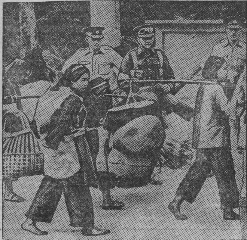
К военным действиям в Китае. Японские самураи при захвате китайских городов зверски расправляются с мирным населением...