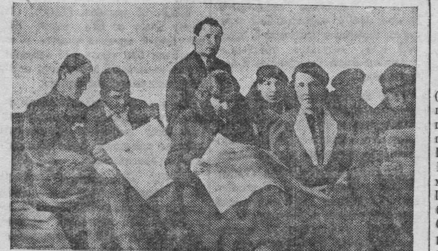
24 декабря 1939 года. На снимке: громкая читка газет в комнате отдыха избирательного участка № 15.