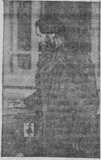
24 декабря 1939 года. На снимке: голосование на избирательном участке № 45.