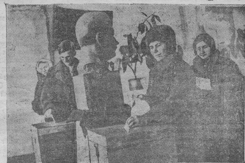
24 декабря 1939 года. На снимке: момент голосования на избирательном участке № 34.

Праздник в клубе продолжается до поздней ночи. (ТАСС).