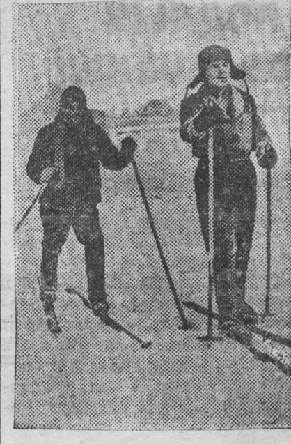
На снимке: на лыжной прогулке.