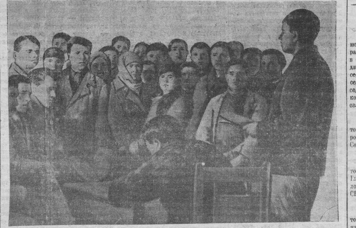
НА СНИМКЕ: Митинг протеста коллектива Уралсибспецстрой, против наглой провокации финляндской военщины.

По поручению бойцов и командиров №-ой части: Младший лейтенант КУДЕННО, бойцы ЕЛИСОВ, ДРОЗЮ.