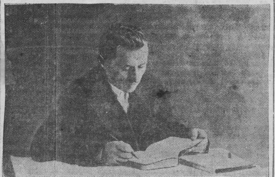
Пропандист кружка истории ВКП(б) тов. Фролов готовится к очередному занятию.