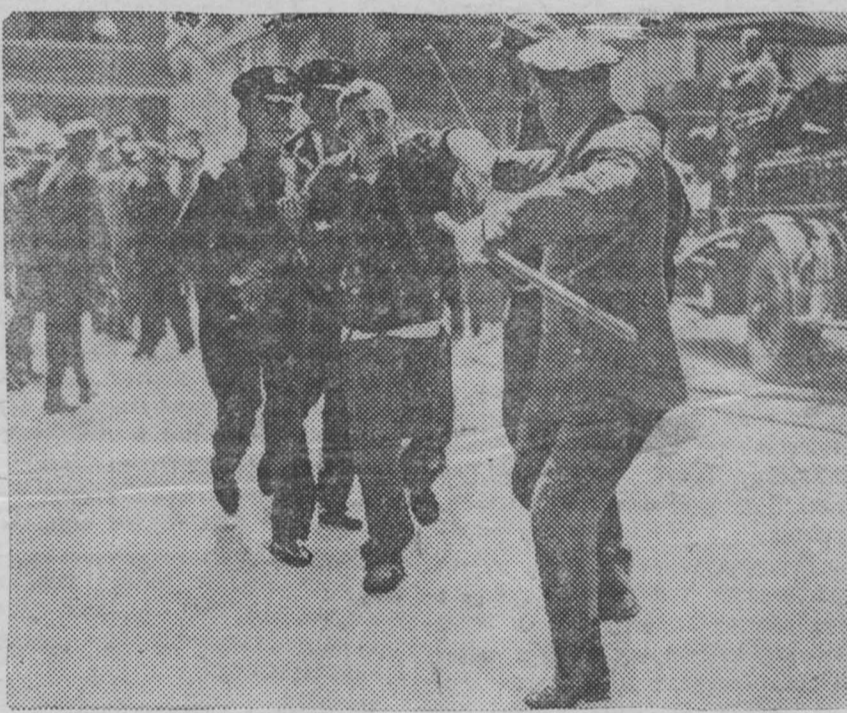
В г. Кливленде (штат Огайо, США) состоялась демонстрация 5000 бастующих рабочих завода «Фишер боди корпорейшн». Полиция напала на демонстрантов и пустила в ход газовые бомбы. На снимке: Полицейские ведут арестованного демонстранта.

Чжен Чен сказал, что по имеющимся в распоряжении китайского командования письмам японских солдат и офицеров можно судить о растущей в японской армии ненависти к войне. «Теперь совершенно ясно, — сказал генерал Чжен Чен, — Япония не сможет выполнить своего плана по завоеванию Китая. Последние успехи китайской армии показывают, что Япония не располагает силой, достаточной для захвата обширных территорий внутри Китая».