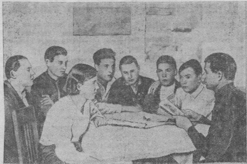
На снимке: Занятие кружка по сдаче норм ПВХО 1 ступени на Кемеровской ГРЭС. Проводит занятие инструктор ПВХО тов. В. Бойко.