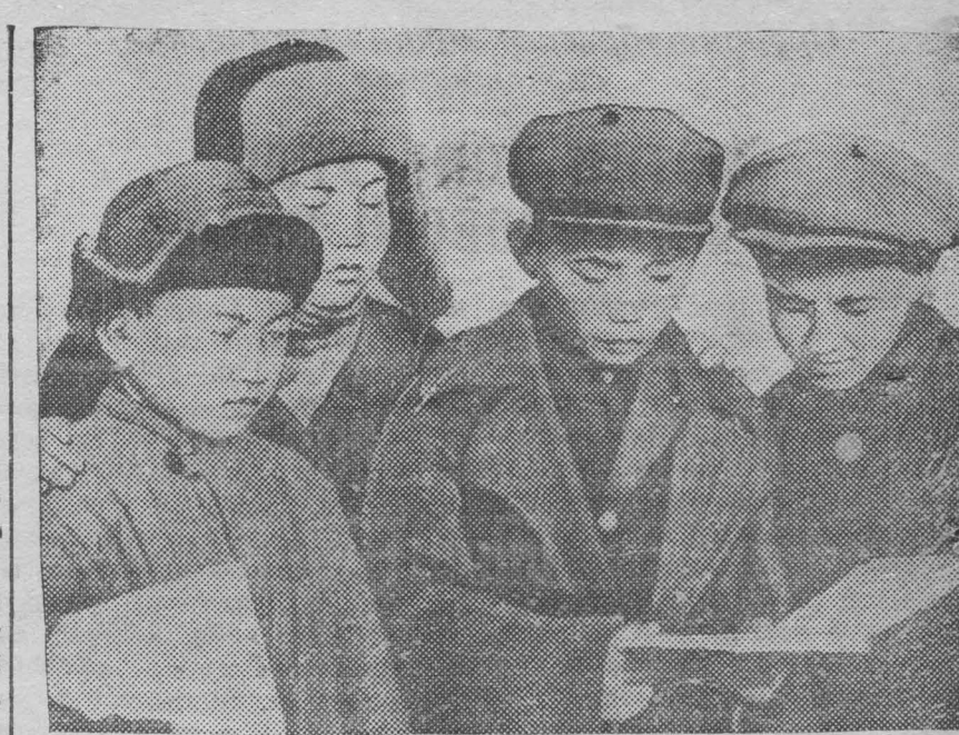
На снимке: Ученики начмены 4—5 классов школы шахты «Пионер» рассматривают новые учебники на родном языке Фото Сорокина.

17 октября в Москву прибыла германская правительственная комиссия во главе с советником г. фон-Кампфенер, для переговоров об эвакуации из Западной Украины и Западной Белоруссии германских граждан и лиц германского происхождения, желающих переселиться в Германию.