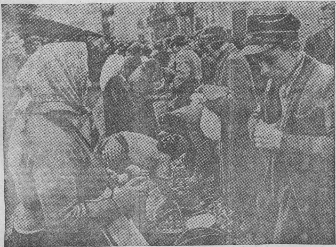
По городам и селам Западной Украины. На снимке: На базаре в гор. Ровно.