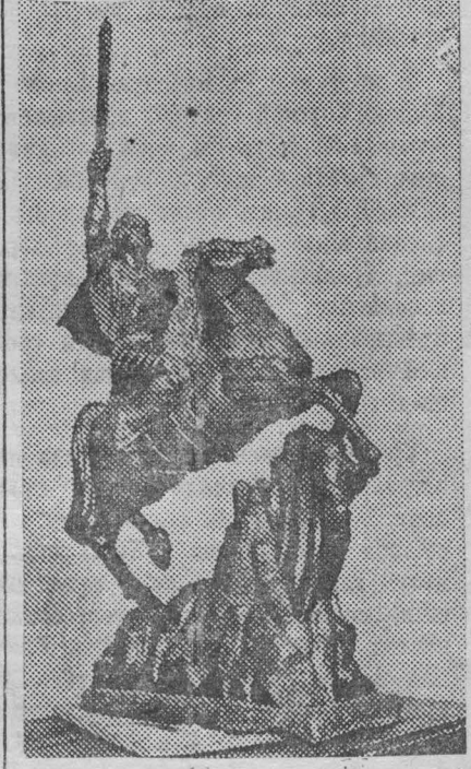
Скульптура «Давид Сасунский на коне» — работы О. Беджаняна.