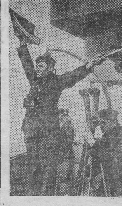
На снимке: Сигнальщики линейки «Парижская Коммуна».

В Ижевск вернулись из пробела мотоциклисты, испытывающие перед сдачей в серийное производство машину новой марки «ИЖ-9». Испытания закончены. По горным, проселочным и шоссеиным дорогам Амурского, Урала, Кировской