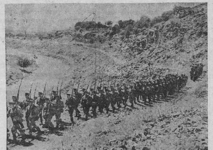
Ближневосточная граница СССР. Тактические учения Н-ской пограничной части. На снимке: движение колонны в горных условиях.

Парторганизация должна объявить борьбу с авариями, каждый случай поломки или аварии должен обсуждаться в парторганизации; улучшить партийное руководство работой завкома и постройкома. Добиться такого положения, чтобы вопросы развертывания социалистического соревнования были в центре внимания всей профсоюзной работы на электростанции.