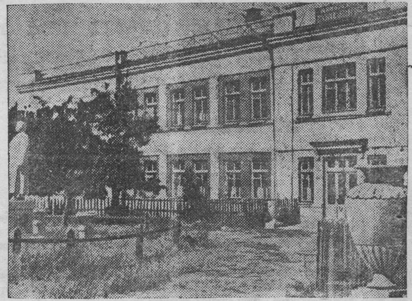
На родине стахановского движения в гор. Ирмино (Донбасс) выстроена новая больница с родильным отделением. На снимке: здание новой больницы.

срочные опытные — зам. гл. бухгалтера, бухгалтер расчетного отдела, бухгалтер материального отдела. Обращаться: в артель «Ударник», Красноармейская, д. № 139.