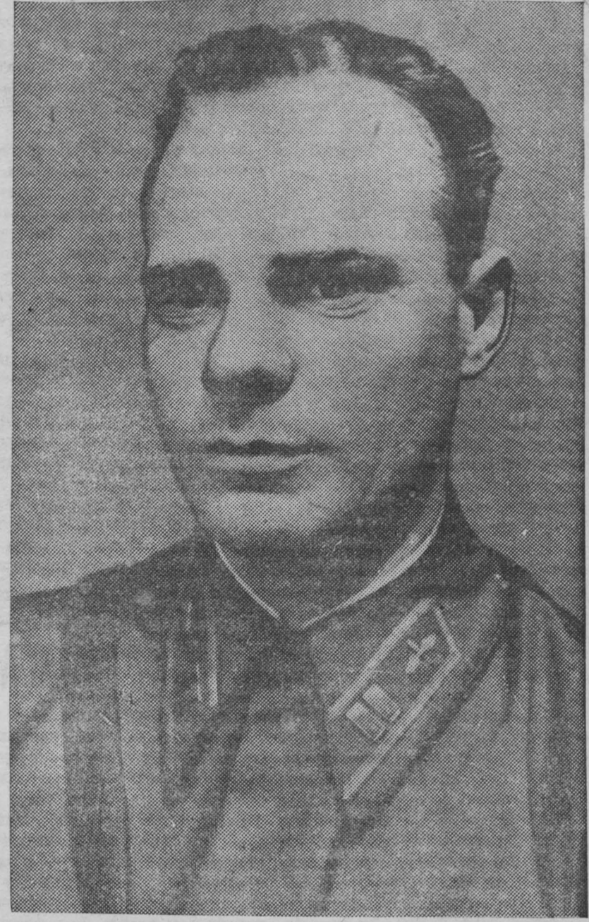
На снимке: Герой Советского Союза майор С. И. Грипец, награжденный второй золотой медалью «Герой Советского Союза».