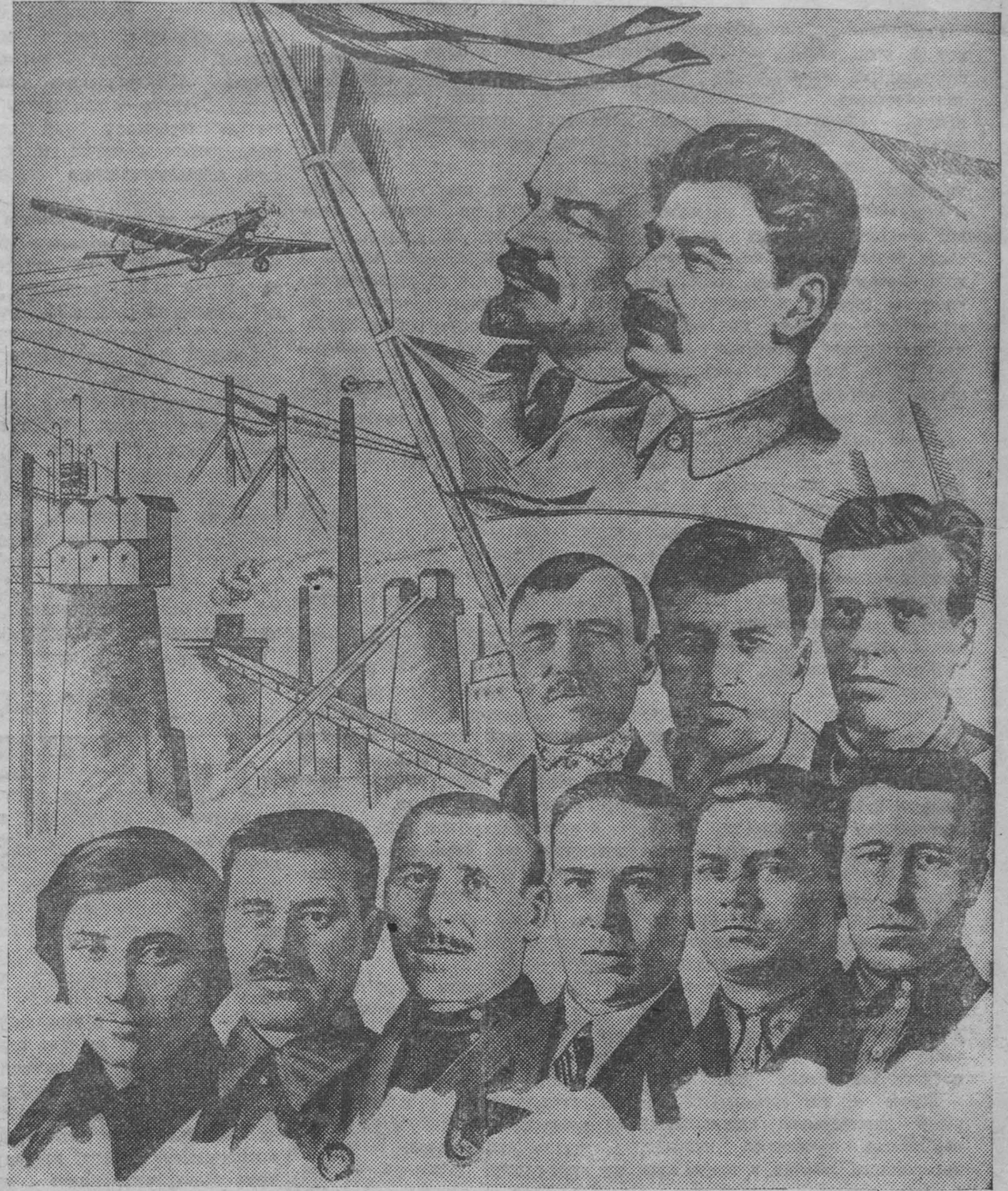
Фото-монтаж В. Скобликова.

В повестке дня внеочередной четвертой Сессии Верховного Совета СССР поставлены серьезные вопросы внутренней и внешней политики. В работе Сессии Верховного Совета великой, могущественной социалистической державы прислушивается весь мир. Нет сомнения, что Верховный Совет СССР, выражая волю всего многомиллионного советского народа, единодушно и мудро, но-спаленски решит все вопросы, стоящие на повестке дня четвертой Сессии. Нет сомнения, что решения Сессии обязательны для всех советских граждан.