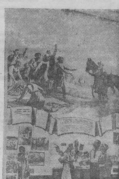
Всесоюзная сельскохозяйственная выставка. На снимке: Упаковка «Встреча акына Джамбула» в павильоне Казахской ССР.