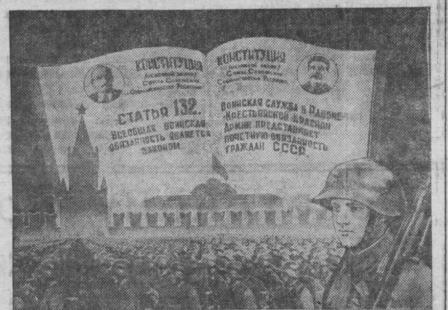
На снимке: плакат, посвященный предстоящему призыву в Красную Армию и Военно-Морской Флот (работы художника Е. Никитина и Н. Крацкина), выпуск Воениздата Наркомата Обороны СССР.