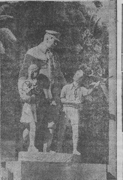
Всесоюзная сельскохозяйственная выставка. На снимке: Скульптурная группа «Товарищ Сталин с детьми», установленная в павильоне «Юннатов».