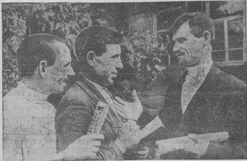
В Широкоплетенский колхоз Ялutorовского района (Омская область) переселились 23 колхозники семьи из Хохольского района (Воронежская область).