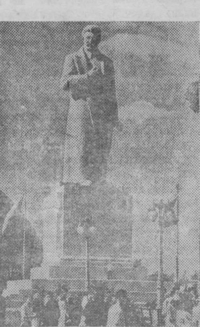
На снимке: Манумент И. В. Сталина, установленный перед павильоном «Механизация».