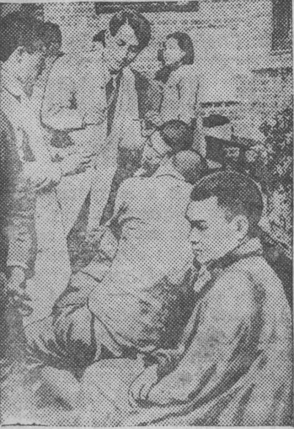
Налеты японской авиации на Чунцин. На снимке: Оказание медицинской помощи жертвам японских бомбардировок.