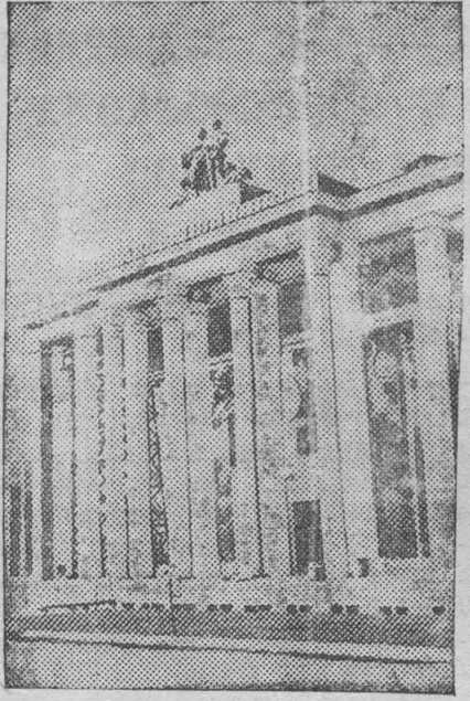
К открытию Всесоюзной сельскохозяйственной выставки (Москва). На снимке: Внешний вид павильона «Сибирь».