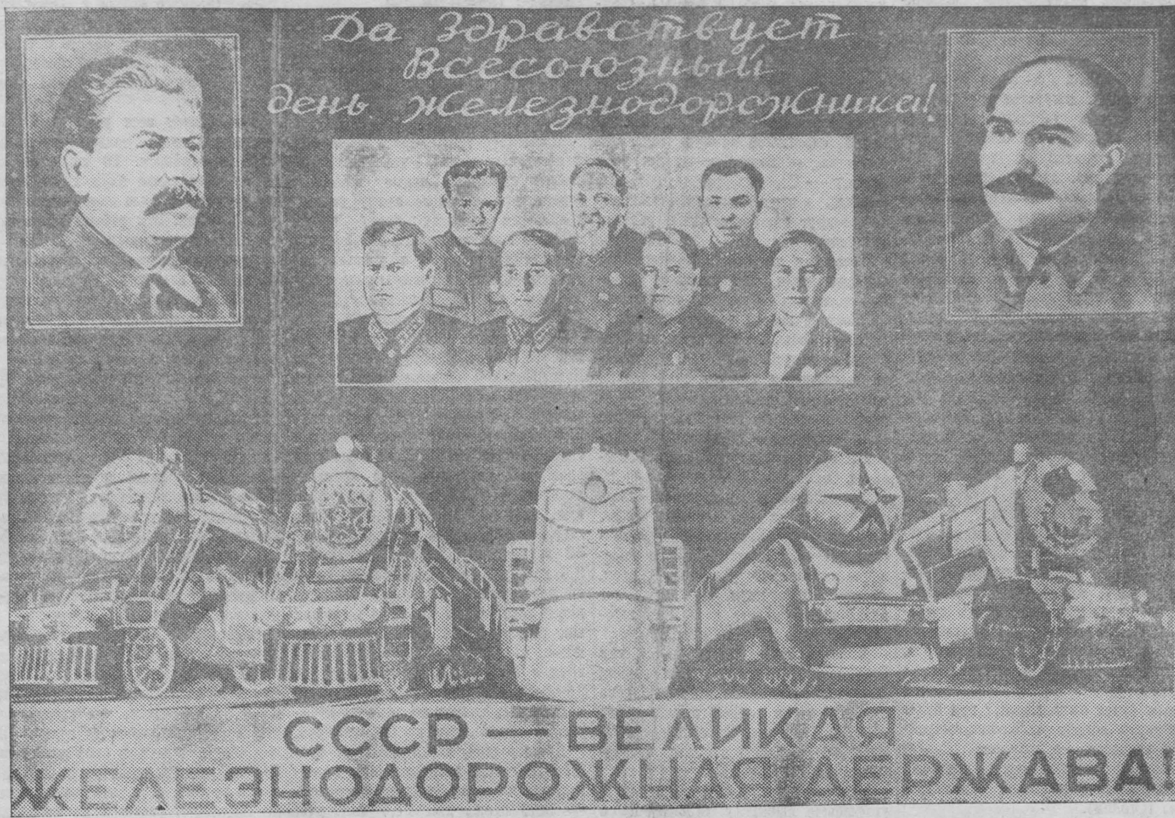
Плакат, выпущенный издательством «Искусство» к Всесоюзному дню железнодорожника. (Работа художника А. Волошина).

Шире и глубже развернем стачановско-кривонососовское движение на транспорте, будем множить ряды новых мастеров социалистического транспорта и на этой основе добиваться новых побед. Мобилизуем всю творческую инициативу и энергию железнодорожников на дальнейший подъем железнодорожного транспорта.