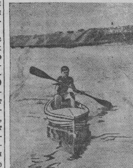
НА БАЙДАРКЕ.

За месяц киномеханик Голиков дал 173 киносеанса, обслужил 15 тысяч зрителей, Кожухов — 166 сеансов, Друганкин — 107 киносеансов.