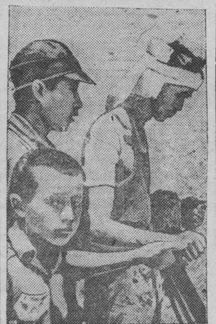
Японская авиация продолжает свои варварские налеты на мирные города Китая, убивая и калеча женщин, детей, стариков. На снимке: раненый во время японской бомбардировки.

По сообщению газеты «Синьвэньбао», действующая в провинции Суйюань дивизия войск марионеточного «правительства» 2 июля присоединилась к китайским войскам. 6 июля в той же провинции на сторону китайских войск перешел 18 полк, состоявший из мобилизованных японцами китайцев. (ТАСС).