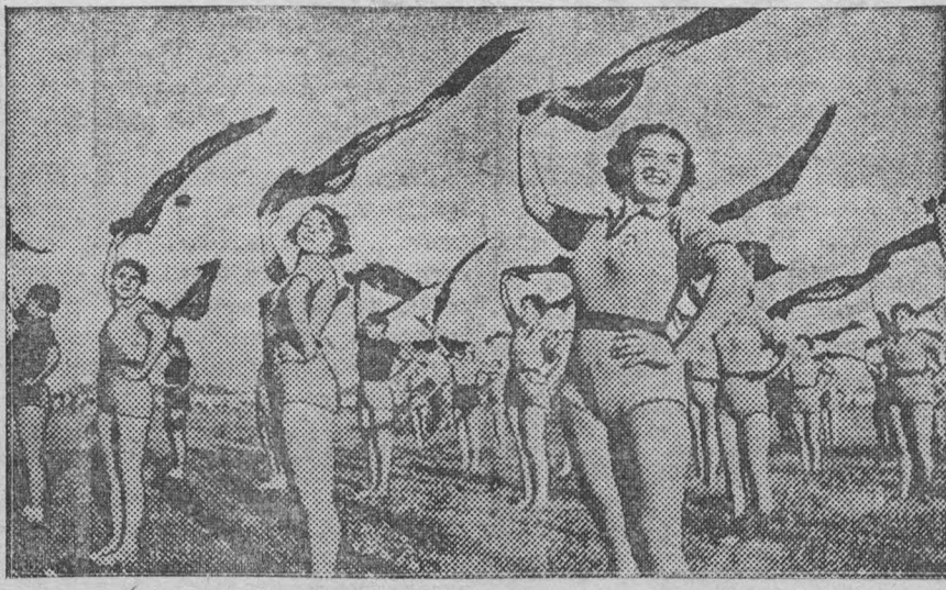
7 июля на московском ипподроме состоялась репетиция парада на Красной площади спортивных обществ Москвы. На снимке: Учасники парада физкультурного общества «Шерстяник».