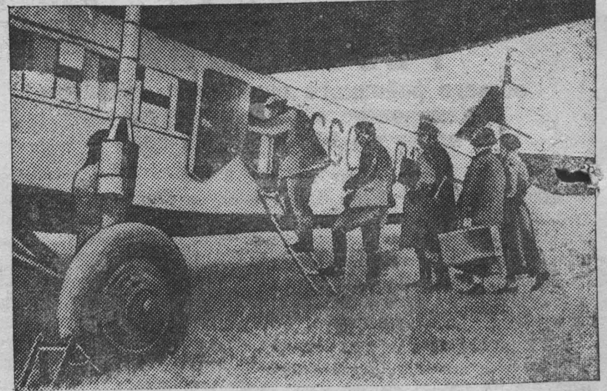
Ежедневно из Новосибирска в Кемерово курсируют почтово-пассажирские самолеты, которые перевозят десятки людей и сотни килограммов груза. На снимке: посадка пассажиров на самолет на Кемеровском аэропорте.

деревьев, устроены цветочные клумбы. Всего на благоустройство Притомского участка затрачивается 300 тысяч рублей.