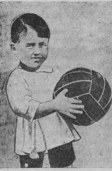
Юный футболист. Фото-этюд П. Мусюк.

Сегодня пионерский клуб проводит прогулку на правый берег, в бор. На свежем воздухе ребята весело проведут время. Они будут с собой футбол, баскетбол, городки и другие игры.