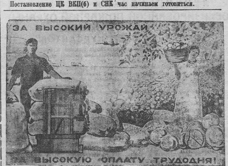
На снимке: плакат работы художников Г. Темникова и М. Коварской, выпущенный издательством «Искусство» к открытию Всесоюзной сельскохозяйственной выставки.