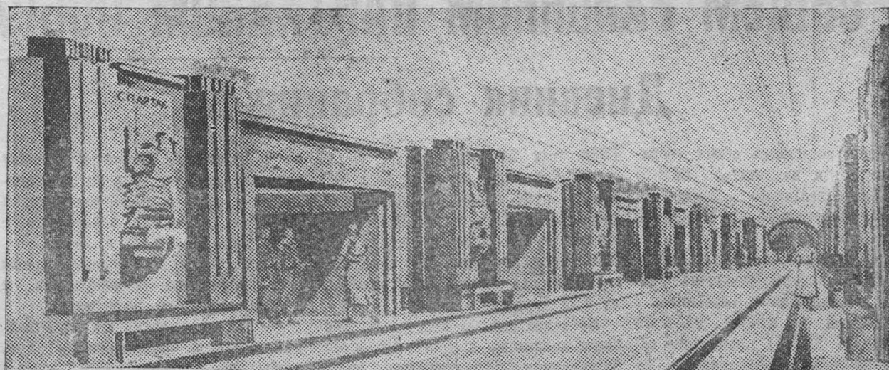
Строительство метрополитена III очереди. На снимке: Проект станции «Спартакская» (автор проекта архитектор Б. М. Иофан).

С 19 июня в связи с большими маневрами японской армии в районе Цзяннаня (в 24 километрах севернее шанхайского международного поселения) в Шанхае создается тревожное положение. (ТАСС).