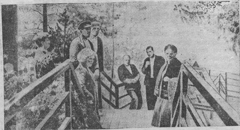
В Елькевском доме отдыха.