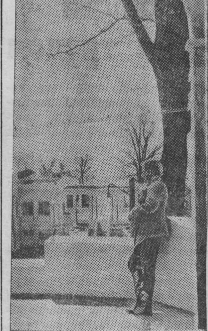
В Сочинский санаторий «Правда» после окончания зимнего ремонта, прибыли первые отдыхающие. На снимке: вид санатория «Правда» с проспекта имени Сталина. Фотохроника ТАСС.

В международных соревнованиях участвуют 268 команд от 17 стран, в том числе 45 команд от СССР, 39 — СИПА, 22 — Швеция, 20 — Польша и т. д. (ТАСС).