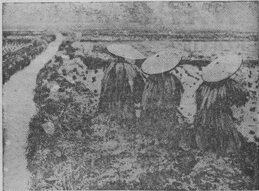
Нидета японской деревни. На снимке: Японские крестьяне, одетые в соломенные одежды, работают на рисовых полях.