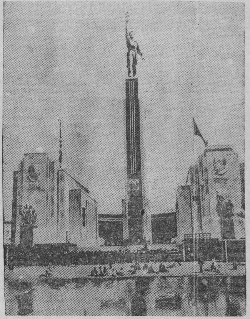
Международная выставка в Нью-Йорке. На снимке: Советский павильон на выставке.

Из сказанного следует, что позиция Советского Союза в вопросе о защите трех балтийских стран от агрессии является единственно правильной позицией, вполне соответствующей интересам всех миролюбивых стран, в том числе интересам Эстонии, Латвии и Финляндии.