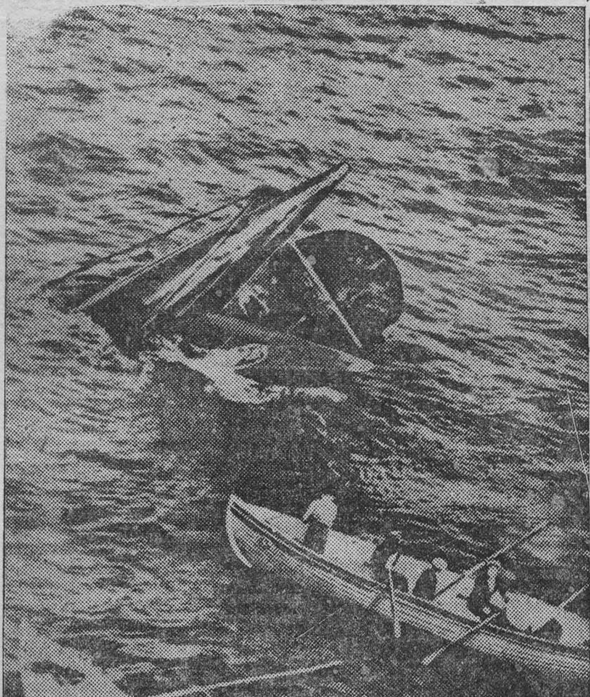
В Ливерпульском заливе затонула английская подводная лодка "Тетис". В лодке находился 101 человек. На снимке: На месте катастрофы.