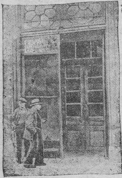
Жизнь и быт трудящихся за рубежом. На снимке: безработные Брюсселя (Бельгия) у ночлежного дома.