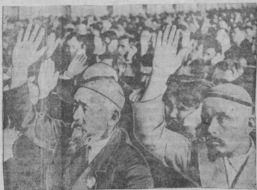
Третья Сессия Верховного Совета СССР. Заседание Совета Национальностей 29 мая. На снимке: депутаты голосуют за утверждение «Закона о государственном бюджете Союза Советских Социалистических Республик на 1939 год».

В целях увековечения памяти героев Хасана: 1. Переименовать Посетский район, Приморского края, в Хасанский район. 2. Соорудить памятник в районе хасанских боев. 3. Сооружение памятника поручить оргкомитету Президиума Верховного Совета РСФСР по Приморскому краю. 4. Установить день 6 августа праздником героев Отдельной Краснознаменной Армии, как день генеральной атаки частей 1-й ОКА, взяв