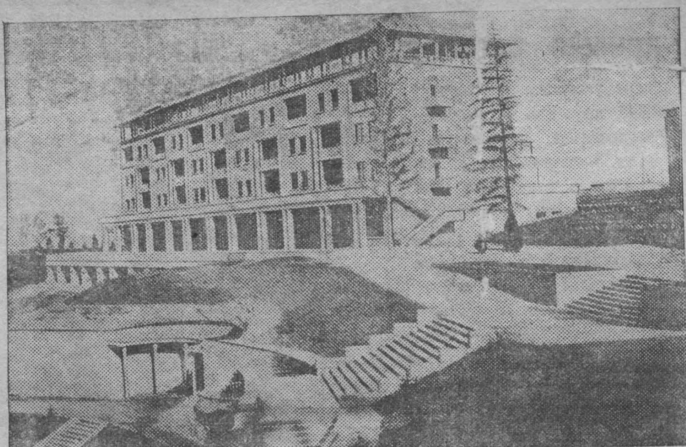
Один из корпусов нового санатория наркомтяжпрома в Киселевске.

Кантонский корреспондент агентства Рейтер сообщает, что 28 мая японские самолеты совершили два налета на Кантон, сбросив много бомб. Среди мирных жителей насчитывается около 500 человек убитых и 900 раненых. Имеется 40 убитых и 50 раненых среди лиц, производивших спасательные работы.